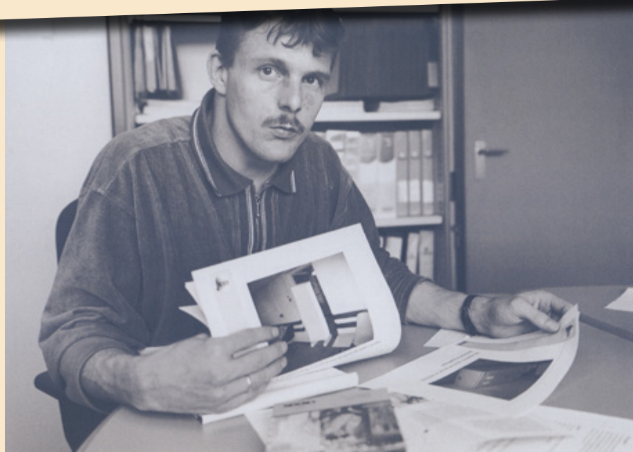
De afdeling Veiligheid: 'Een ongeluk staat nooit op zichzelf'