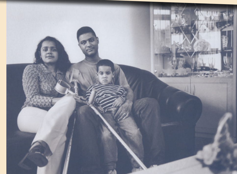
Zijn ernstige ongeval werd de rode draad in het jaarverslag

De roep om transparantie klinkt tegenwoordig steeds luider. Juist vanwege dingen die verkeerd gaan. Maar hoe veel organisaties zijn bereid tot openheid over pijnlijke dossiers? Uit zichzelf en duidelijk voor iedereen. Croon had dat lef al in 1998. Een ongeval werd de rode draad in hun Sociaal Jaarverslag, terwijl de zaak nog onder de rechter was. Spannend dus, maar wat bereik je ermee?